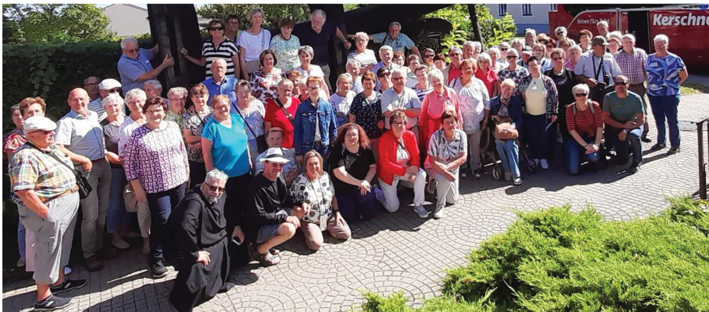
Eine wunderschöne Pfarrwallfahrt an den Neusiedlersee erlebten die Teilnehmer der diesjährigen Pfarrwallfahrt.

Die Pfarren Kilb und Bischofstetten hielten am Samstag, 6. September 2025 die gemeinsame Wallfahrt ins Burgenland ab.