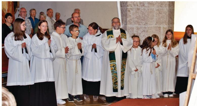
Bei der Familienmesse begrüßten wir unsere neuen Minis und dankten auch den verdienten Minis.