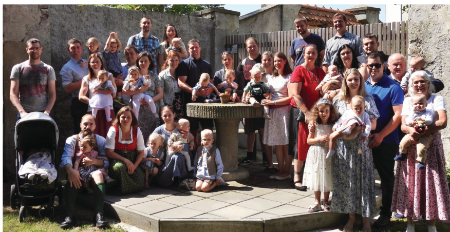
Viele Familien nahmen an der Familienmesse mit Täuflingssegnen und anschließender Agape teil.

Wie jedes Jahr wurden auch heuer alle Täuflingsfamilien der Pfarre Kilb zu einem gemeinsamen Gottesdienst mit Familiensegen eingeladen.