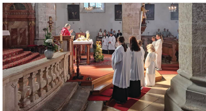
Am 29. Juni wurde auf Servus TV die Hl. Messe aus unserer Pfarrkirche übertragen.