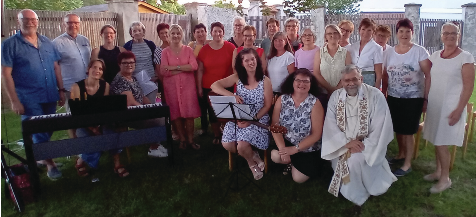
Ein sehr stimmungsvolles und harmonisches Abendlob feierten die Besucher im Pfarrgarten „am himmlischen Platzl“.

Der Kilber Pfarrchor und der Caritasausschuss luden am 8. August 2025 um 19:00 Uhr zum „Abendlob“ in den Pfarrgarten.