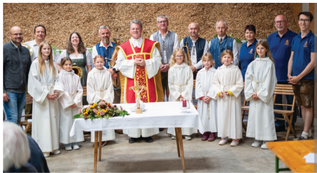
Mit einer Hl. Messe wurden 25 Jahre Weisenblasen bei der Reitkogl Oacha gefeiert.

Am Sonntag, 14. September 2025 feierte der Musikverein Kilb ein besonderes Jubiläum. Aufgrund des Wetters fand das Fest in der Halle der Familie Renz statt.