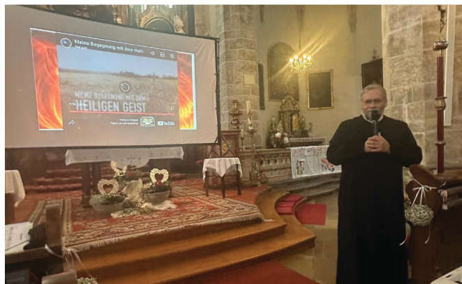
Unter dem Motto „Begegnung mit dem Hl. Geist“ stand der Lobpreis zu Pfingsten.

Im Lobpreis wurden Lieder in Karaokeversion gesungen und eine spirituelle Einspielung von einem jungen Burschen, der die Begegnung mit dem Heiligen Geist zu spüren bekam, gezeigt. Danke für das Mitsingen & Mitfeiern!