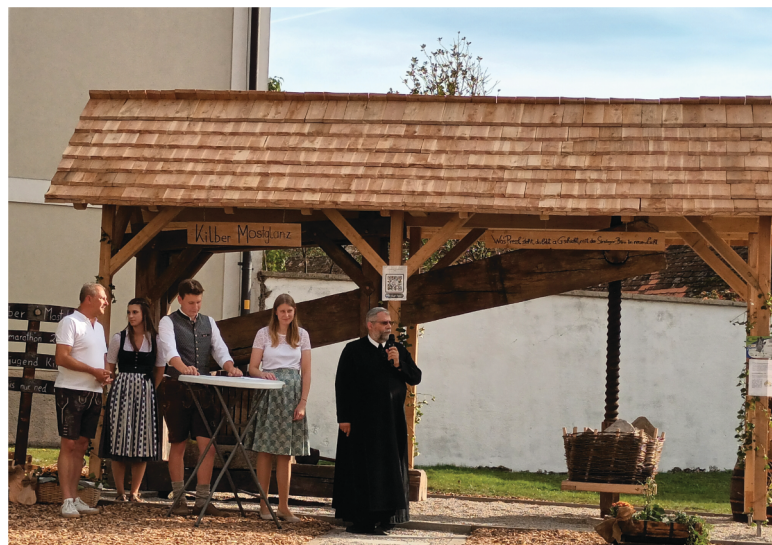
Die altherwürdige Mostpresse wurde von der Landjugend beim Projektmarathon revitalisiert.

Beim diesjährigen Projektmarathon errichtete die LJ Kilb zwischen Pfarrkirche und Pfarrhof einen befestigten Platz für die aus dem Jahr 1797 stammende Mostpresse.