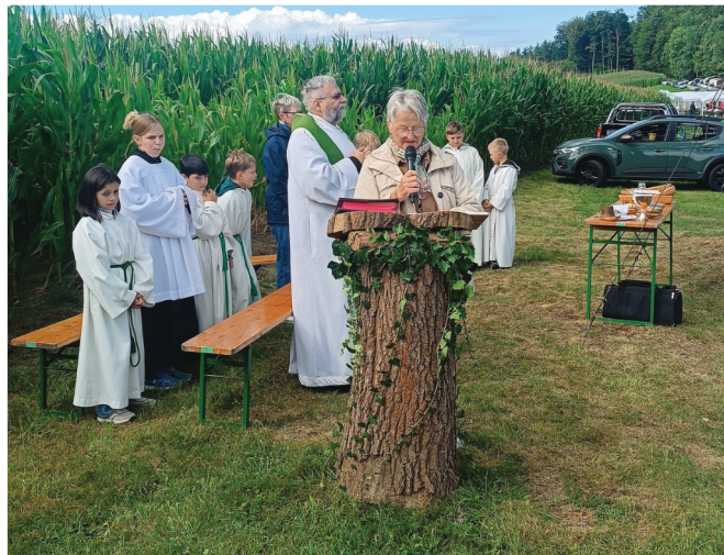
Viele Gläubige aus den Pfarren Bischofstetten und Kilb kamen zur Bergmesse am Hames.

Auch für das leibliche Wohl sorgten die Naturfreunde Bischofstetten bestens. In Zukunft wird diese Bergmesse abwechselnd von den Pfarren Bischofstetten und Kilb gestaltet.