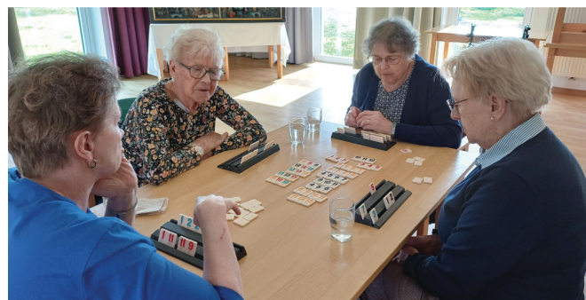
Spaß und Ehrgeiz herrschten beim Spielenachmittag.

Am 12. April veranstaltete der Caritas-Seniorenausschuss wieder einen Spielenachmittag.