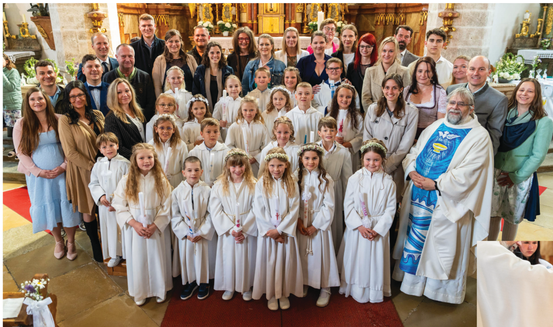
Große Freude herrschte bei den Erstkommunionkindern bei ihrer Erstkommunion (im Bild mit ihren Taufpaten) und ein Mädchen wurde vor seiner Erstkommunion durch die Taufe ein Mitglied unserer Kirche.

Groß war die Aufregung und Freude bei den Kindern der 2. Klassen. Sie feierten den Tag ihrer Erstkommunion und somit die offizielle Aufnahme in die Tischgemeinschaft der Pfarrgemeinde.