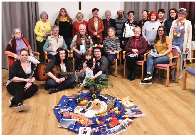
Mit netten Gesprächen fand der heurige Weltgebetstag der Frauen einen sehr harmonischen Abschluss.

Am Freitag, 7. März 2025 wurde der Weltgebetstag der Frauen bereits zum 46. Mal in Kilb gefeiert. 20 Frauen, 2 Männer und 1 Kind folgten der Einladung, um gemeinsam für die Anliegen des Weltgebetstags zu beten und zu singen. Frauen von den Cookinseln hatten heuer die Texte unter dem Titel „Wunderbar geschaffen“ (Psalm 139,14) vorbereitet.