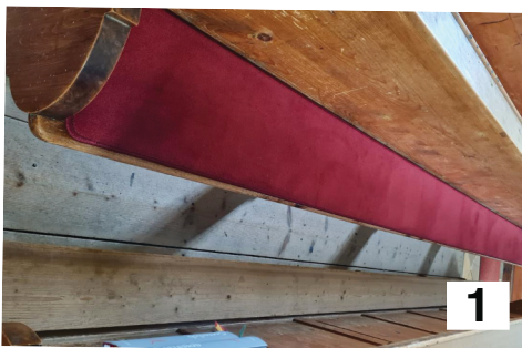
1 Kirchenbanksitzauflagen in unserer Kirche