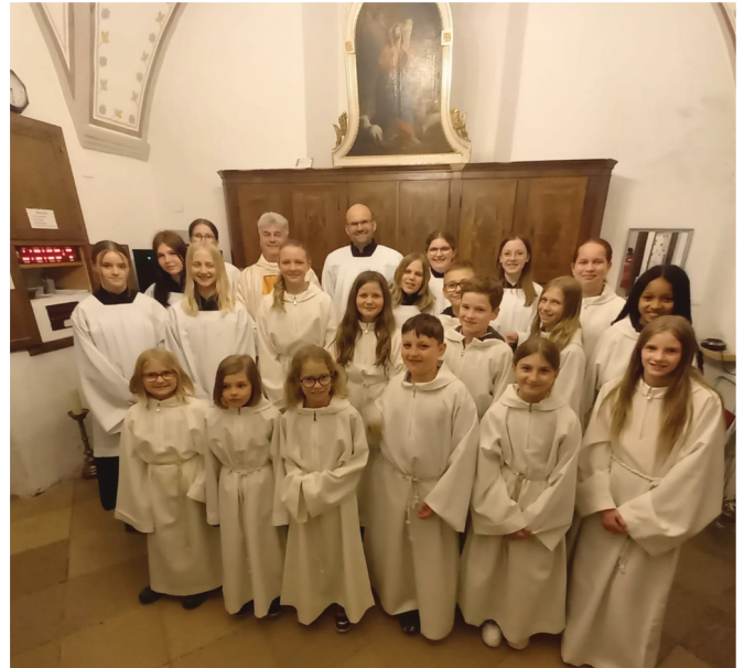
Auf Instagram geben die Minis Einblicke in ihre Aktivitäten (sh. auch Titelbild).