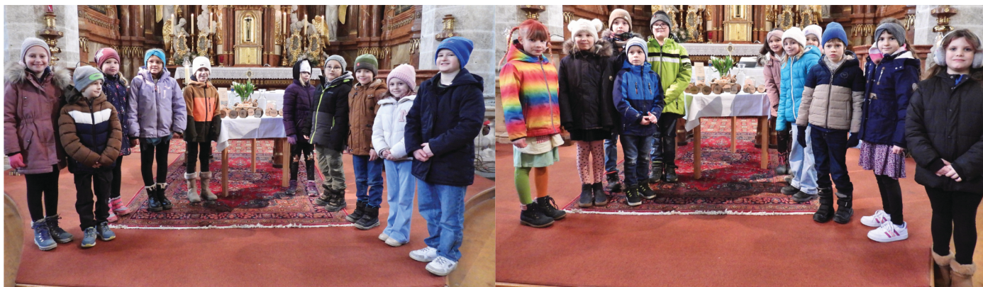
Die Erstkommunionkinder der 2. Klassen stellten sich im Zuge der Familienmesse der Pfarrgemeinde vor.